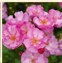
ラベンダー メイディランド®