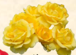
レヨンドウ ソレイユ