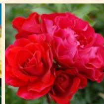
スーリールドウ モナリザ