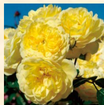
ベル ロマンティカ®