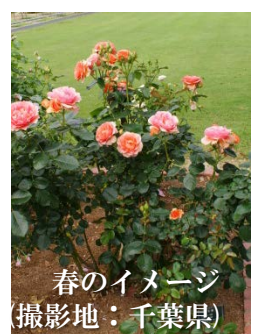
春のイメージ (撮影地：千葉県)