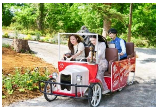
(左) 高台の上に浮遊感あふれる「ハートの女王の無重力展望台」が秋限定で初登場 (右) 京成バラ園初の自走式ライド系アトラクション「アリスツアーズ」が初の秋装飾で実施

秋のバラ園は収穫祭をテーマに「展望台」「アトラクション」「フード」「ドリンク」「ファッション」と新コンテンツが目白押し