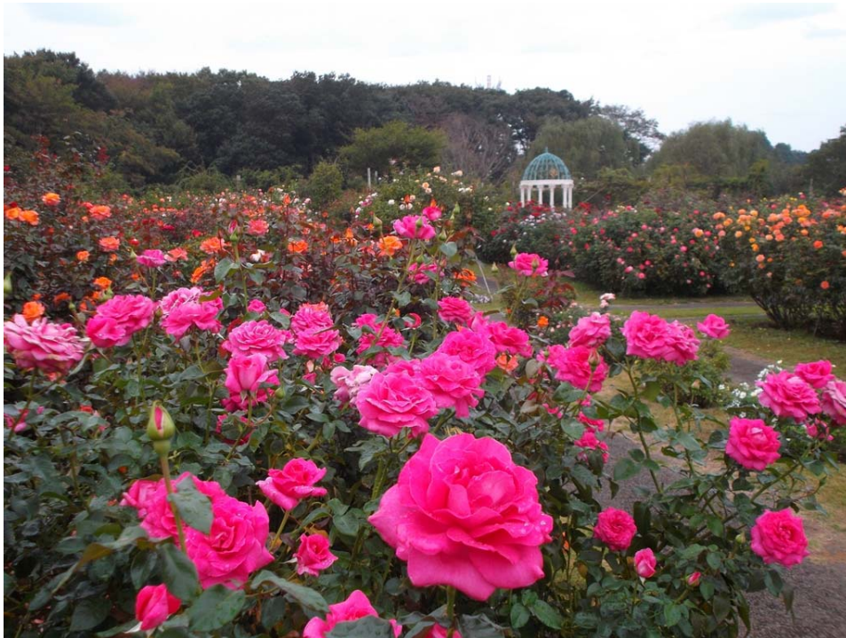
10/15(火)撮影 ローズガーデン風景

★台風26号の影響も今週末には回復し、予定通りバラをお楽しみいただける予定です。