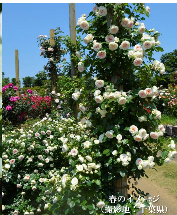
春のイメージ (撮影地：千葉県)

花付き花保ちが良く、カップ咲きの花が房で咲きます。秋の花付きも良く生育旺盛で、枝がまっすぐ伸びる素直な樹形の為、小型のつるバラとしても使えます。爽やかな緑色の葉も美しく、うどんこ病に強いです。