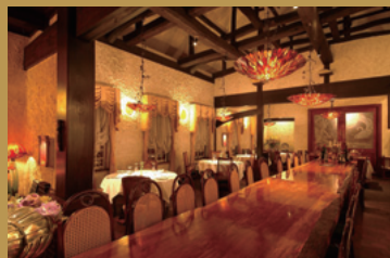
岡本太郎画伯が愛した1枚板のテーブルが 中央にあります。