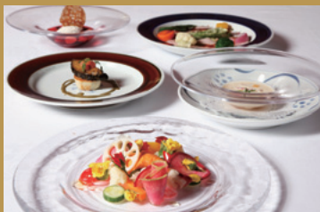
貝殻亭のシェフが織りなす美食のコース料理を お楽しみ下さい。(お料理はイメージです)