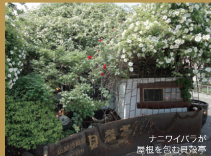
ナニワイバラが 屋根を包む貝殻亭

《ご予約・お問い合わせ》受付期間：5/14(月)~5/20(日) 10:00~17:00